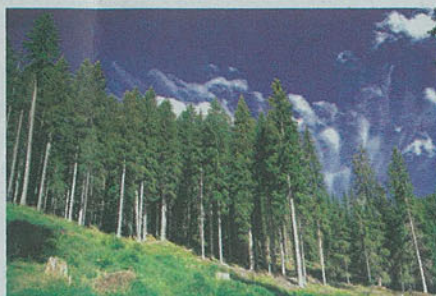
La foresta di Paneveggio

Da una parte la produzione, dall'altra la sperimentazione. I boschi del Trentino non diminuiscono, perché la gestione delle foreste qui avviene in modo sostenibile, osservando scrupolosamente alcuni criteri, come i protocolli certificati a livello europeo e mondiale, per evitare abusi e sprechi. Tra questi, c'è ad esempio l'obbligo di conservare la diversità biologica degli ecosistemi forestali. Ma c'è di più. Da un paio d'anni esiste infatti il Distretto del legno che raggruppa le aziende che producono il legno, ma anche istituti di ricerca che ne studiano i nuovi utilizzi, come ha fatto l'Ivalsa di San Michele all'Adige con la sperimentazione della casa antisismica. In questo modo, si accorpia in un'unica zona tutto il ciclo produttivo del legno: dal taglio alla lavorazione alla ricerca.